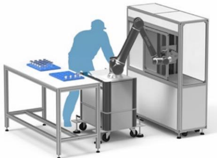
マシンテンディング