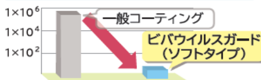
ウイルス平均感染価log(PFU/試料)