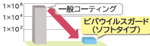
ウイルス平均感染価log(PFU/試料)